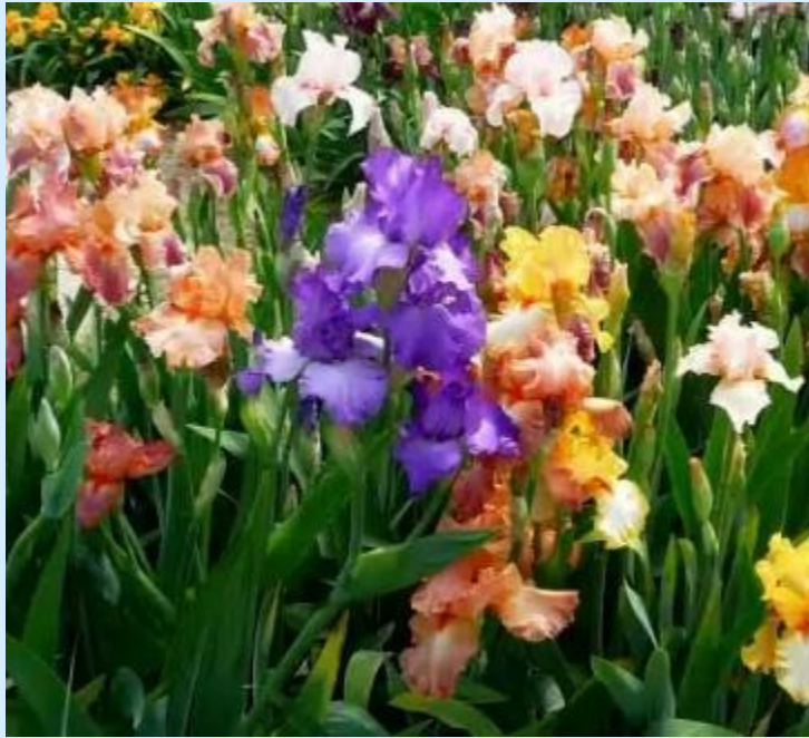
Півники на квітнику.