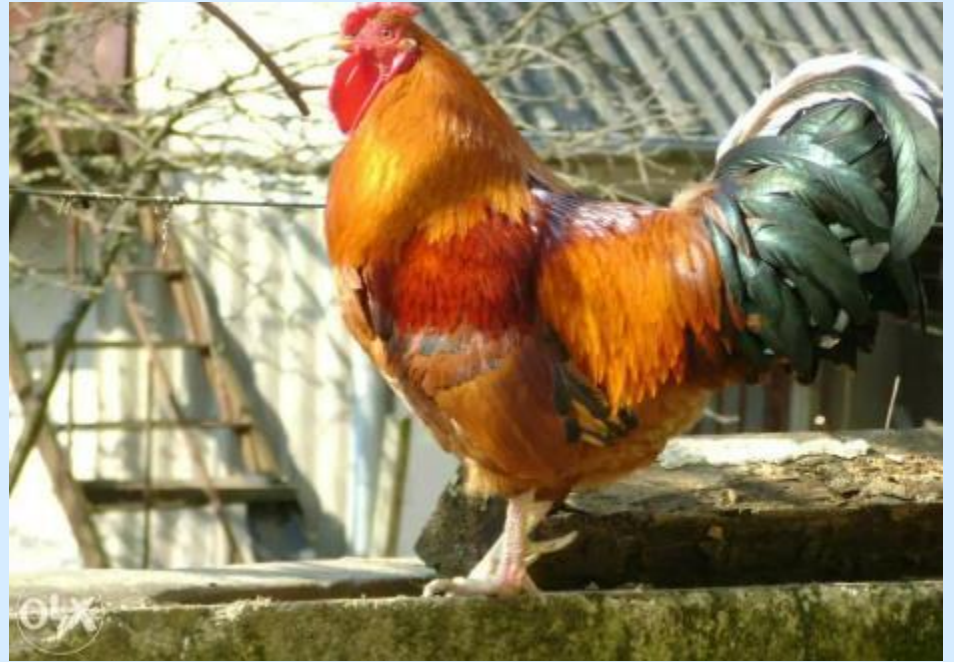
Півник у дворі: ку-ку-рі-ку!