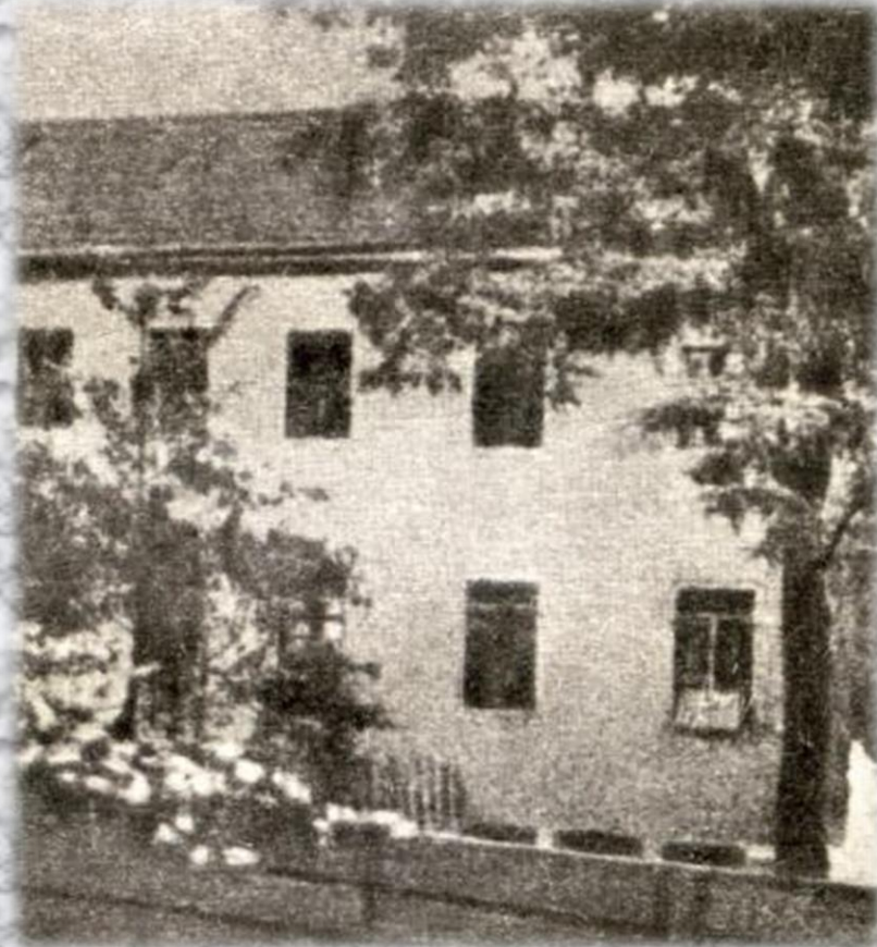
У цьому будинку народився Г. Гейне