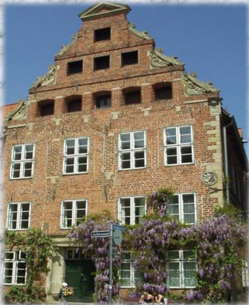
м. Дюссельдорф. Будинок, в якому жили батьки Гейне