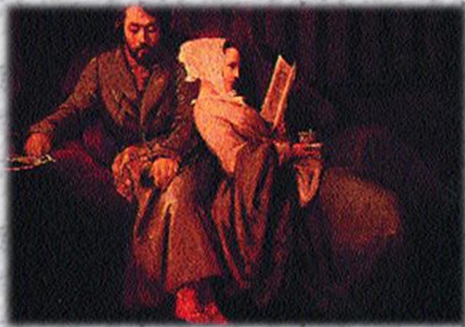
Генріх Гейне та його дружина Матильда